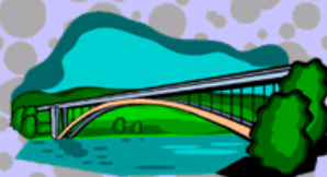
Řeka řeka Labe